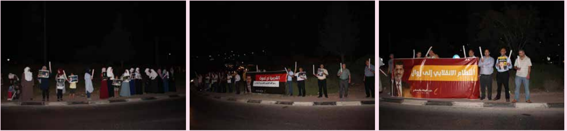
وقفه المشاعل لحزب الوفاء والإصلاح على دوار الرينة المشهد قضاء الناصرة انتصاراً للشرعية التي يمثلها الراحل المرحوم الدكتور محمد مرسي 19-5-2019